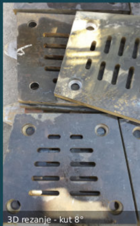
3D rezanje - kut 8°