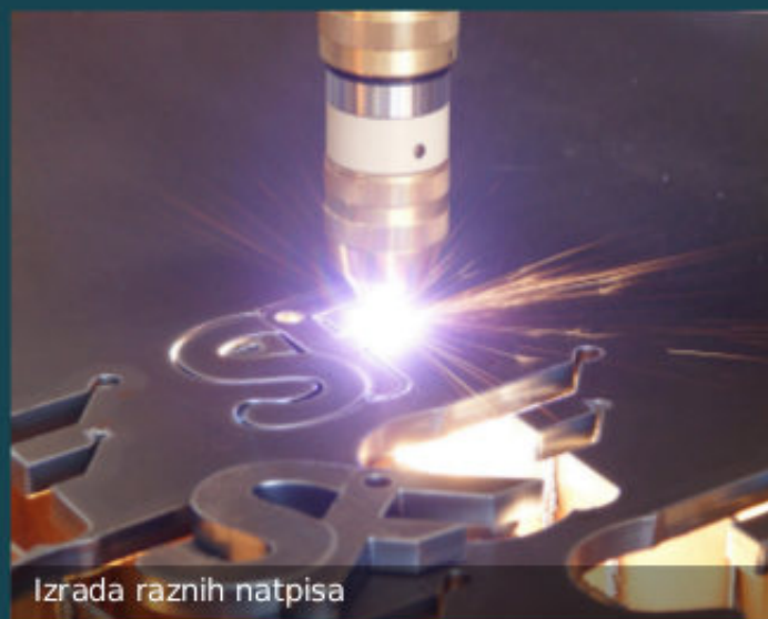
Izrada raznih natpisa