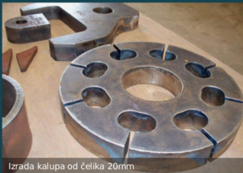
Izrada kalupa od čelika 20mm