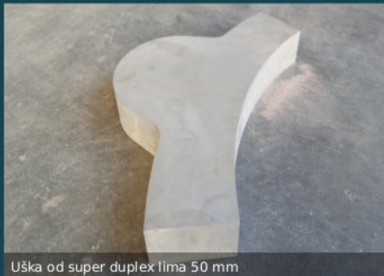
Uška od super duplex lima 50 mm