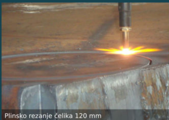
Plinsko rezanje čelika 120 mm