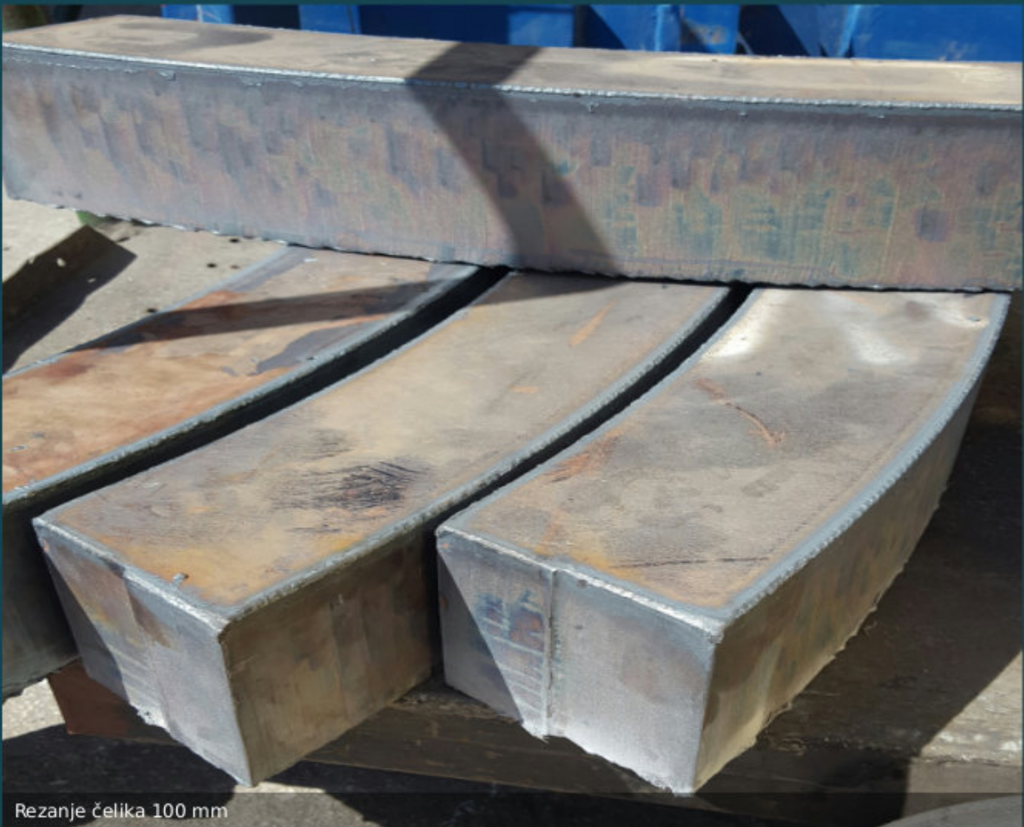
Rezanje čelika 100 mm