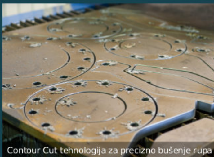
Contour Cut tehnologija za precizno bušenje rupa