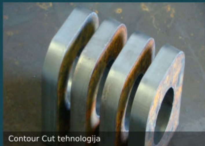
Contour Cut tehnologija

Plazma rezanje je učinkovito kod rezanja čeličnih limova. Rezanje vršimo CNC Contour Cut tehnologijom koja omogućava preciznost kod rezanja manjih rupa na limovima.