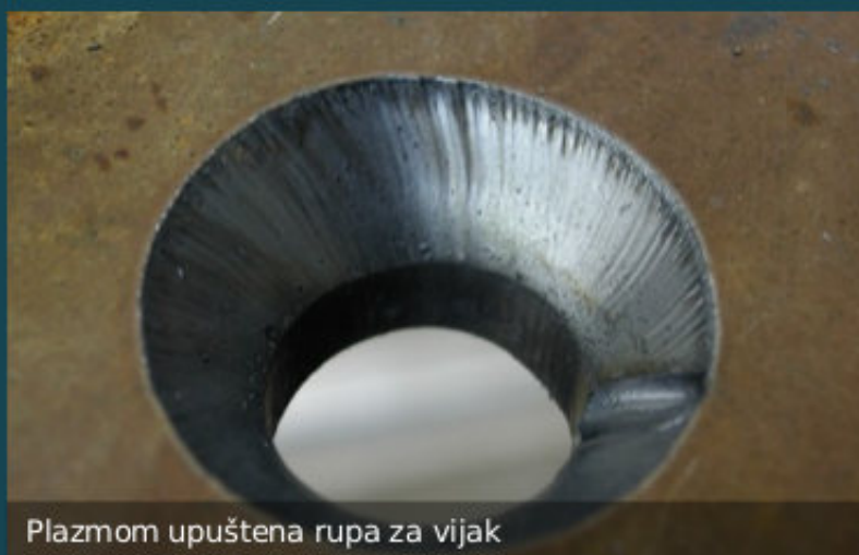
Plazmom upuštena rupa za vijak