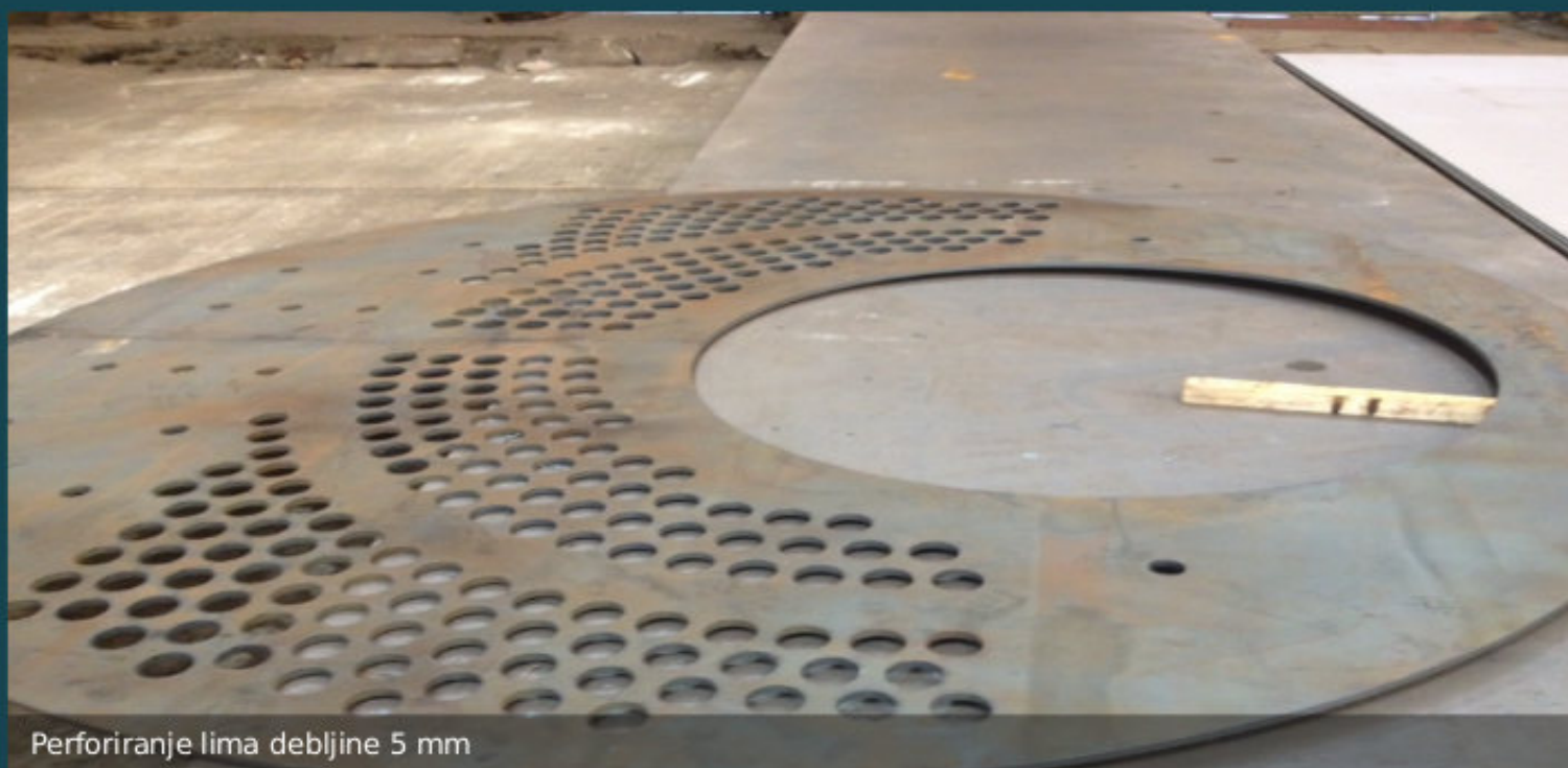
Perforiranje lima debljine 5 mm