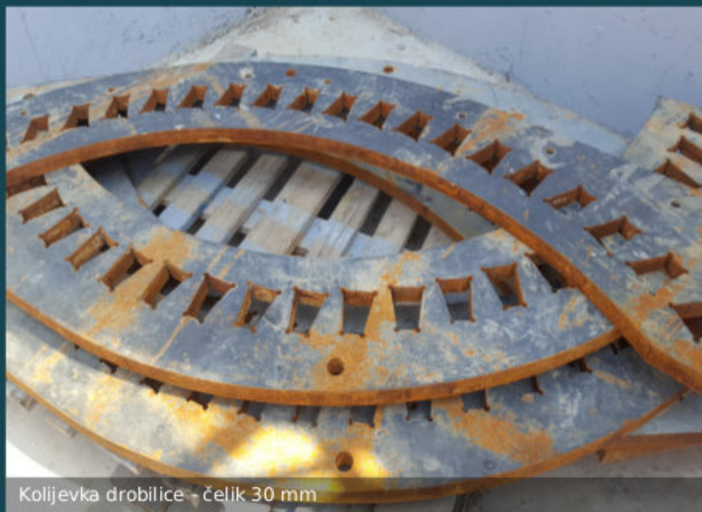
Kolijevka drobilice - čelik 30 mm