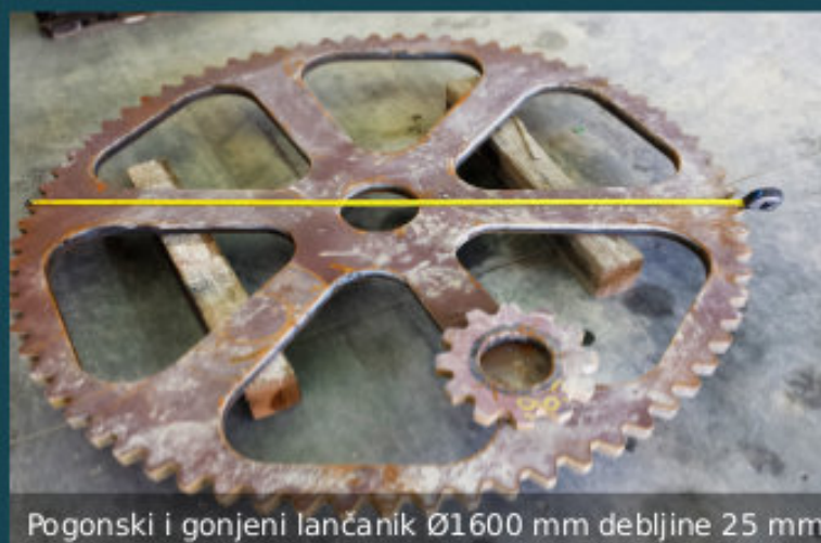
Pogonski i gonjeni lančanik Ø1600 mm debljine 25 mm